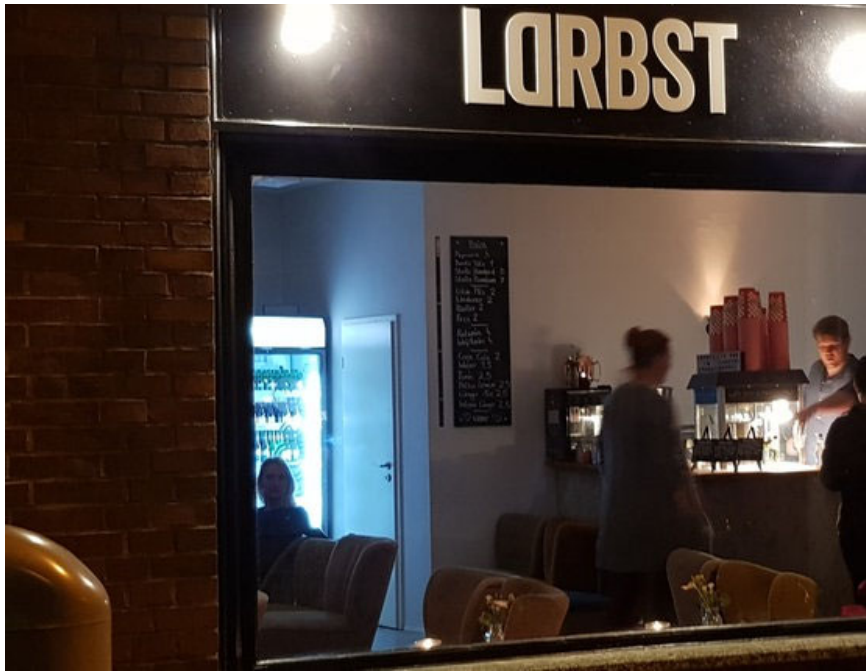
Anfang 2018 eröffnete das "Lodderbast" in Hannovers Südstadt - eine Art Mi des Mainstreams.